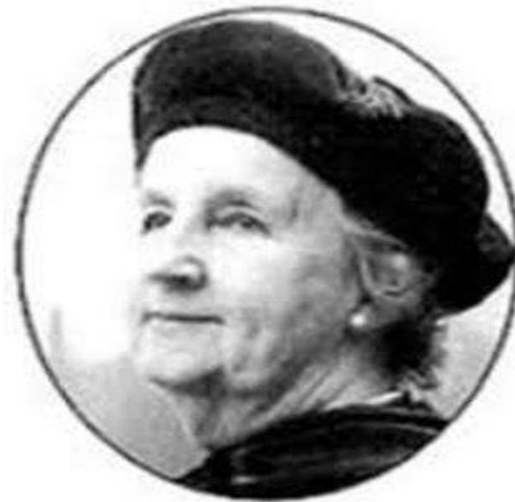
Вирджиния Хендерсон Американская медицинская сестра, преподаватель и выдающийся просветитель.