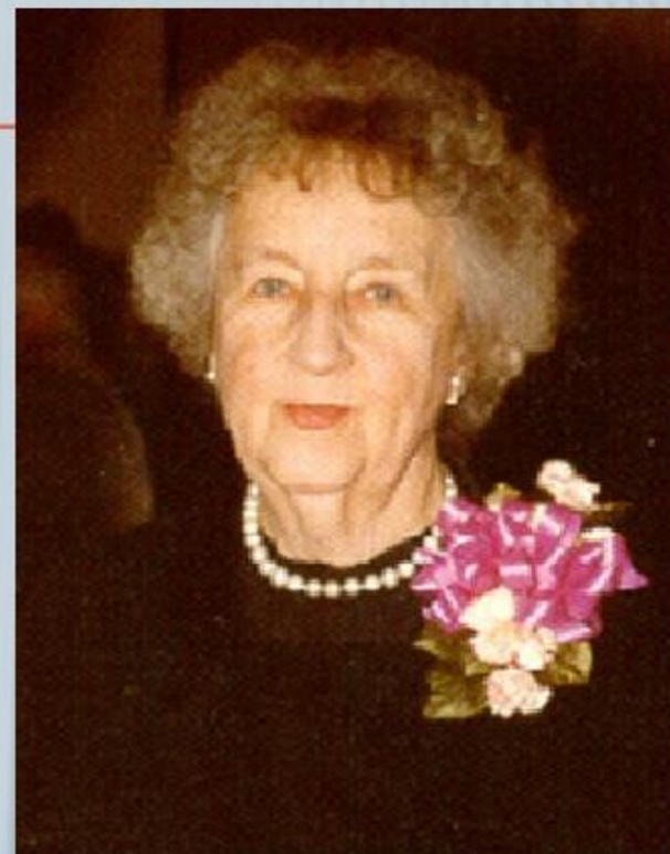
Вирджиния Хендерсон 1987-1996

Сестринский процесс – это «оказание помощи человеку, больному или здоровому, в осуществлении тех действий, имеющих отношение к его здоровью, выздоровлению или спокойной смерти, какие бы он принял сам, обладая необходимыми силами, знаниями и волей. И делается это таким образом, чтобы он снова как можно быстрее обрел независимость».