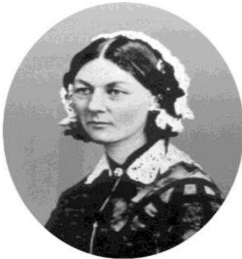
Флоренс Натингейл Основоположница сестринского дела, сестра милосердия и общественный деятель Великобритании.